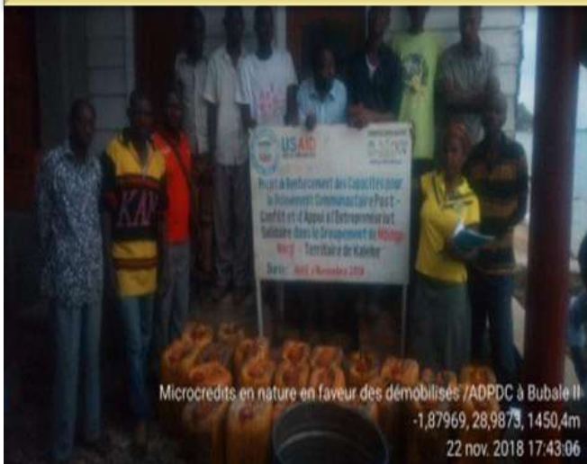
Microcredits en nature en faveur des démobilisés /ADPDC à Bubale II