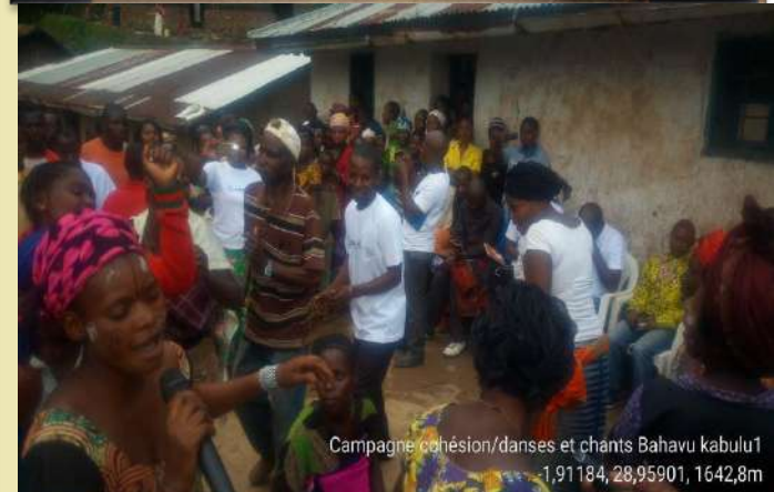
Campagne cohésion/danses et chants Bahavu kabulu1 -1,91184, 28,95901, 1642,8m