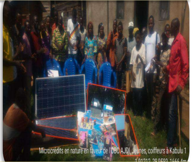
Microcrédits en nature en faveur de l'OBC AJDI, Jeunes, coiffeurs à Kabulu 1