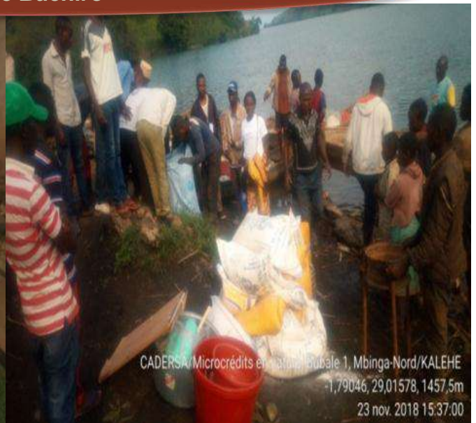
CADERSA/Microcrédits en nature, Bubale 1, Mbinga-Nord/KALEHE -1,79046, 29,01578, 1457,5m 23 nov. 2018 15:37:00