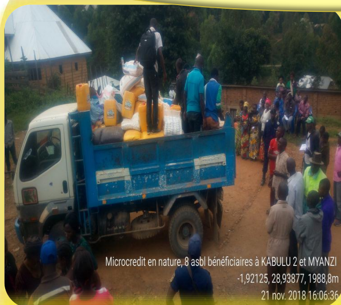
Microcredit en nature, 8 asbl bénéficiaires à KABULU 2 et MYANZI -1,92125, 28,93877, 1988,8m 21 nov. 2018 16:06:36