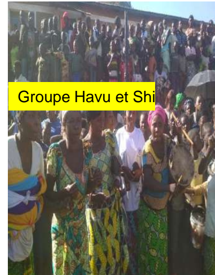
Groupe Havu et Shi