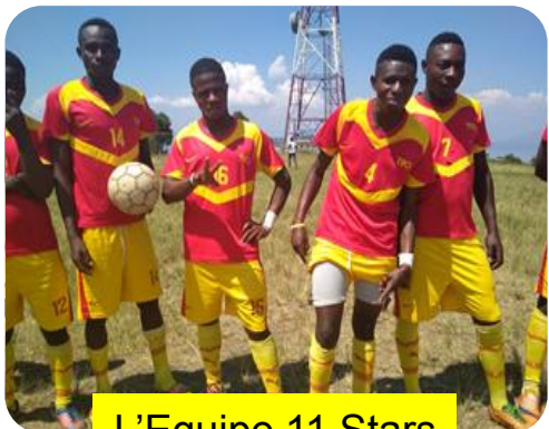
L'Equipe 11 Stars

MATCH DE FOOTBALL : L'Equipe A.S de Nyabibwe contre l'Equipe 11 Stars