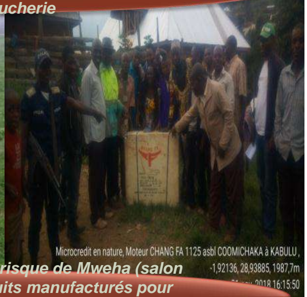
Microcredit en nature, Moteur CHANG FA 1125 asbl COOMICHAKA à KABULU , -1,92136, 28,93885, 1987,7m 21 nov. 2018 16:15:50

Kits solaire pour les jeunes à risque de Mweha (salon de coiffure) et kits des produits manufacturés pour FPS de Buchiro