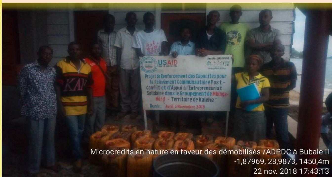
Microcredits en nature en faveur des démobilisés /ADPDC à Bubale II -1,87969, 28,9873, 1450,4m 22 nov. 2018 17:43:13