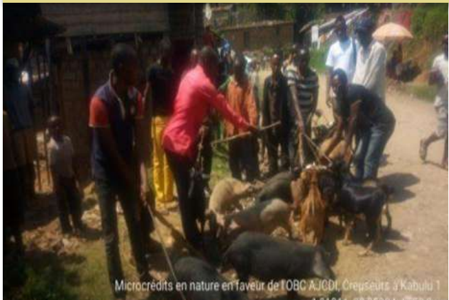
Microcrédits en nature en faveur de l'OBC AJDI, Creuseurs à Kabulu 1