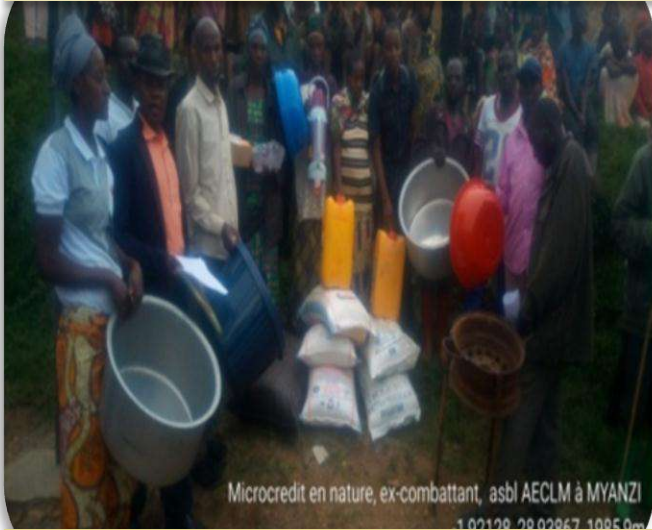
Microcredit en nature, ex-combattant, asbl AECLM à MYANZI