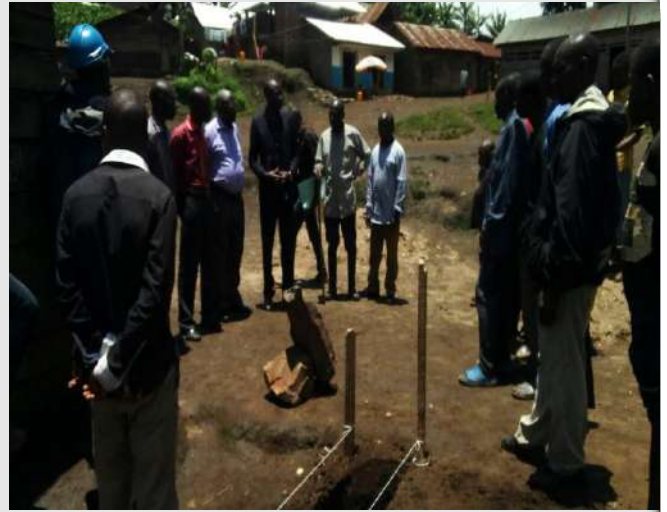
Photo de famille du Président du CADERSA et ses collaborateurs avec le Révérend pasteur, le Préfet, les enseignants et autres fidèles et parents de l'église de la 55è CEBCE, après la pose de la 1 ère pierre de l'institu Butamu/Kabamba