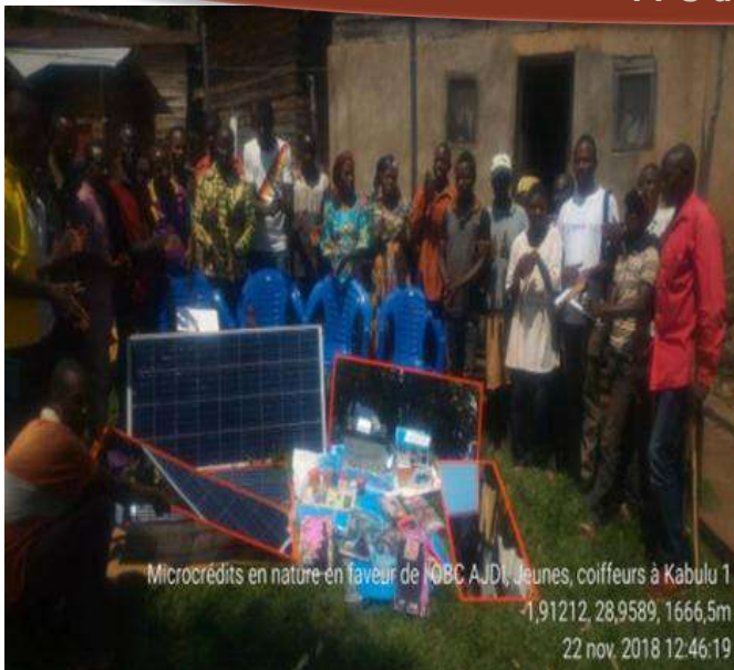
Microcrédits en nature en faveur de l'OBC AJD, Jeunes, coiffeurs à Kabulu 1 -1,91212, 28,9589, 1666,5m 22 nov. 2018 12:46:19

Kits solaire pour les jeunes à risque de Mweha (salon de coiffure) et kits des produits manufacturés pour FPS de Buchiro