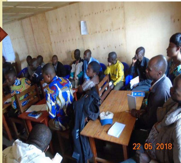
Quelques représentants des groupes cibles

❖ Tenue de l'Atelier d'identification et priorisation des besoins réunissant 25 personnes dont les représentants des groupes cibles, des autorités locales, des membres de la société civile, des femmes et des AGM ;