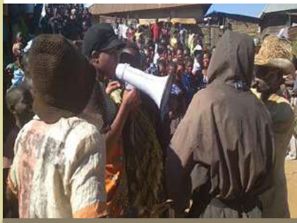
Pièce de théâtre sur la lutte contre l'abus sexuel, l'enrôlement des mineurs dans les groupes armés et la réinsertion sociale des ex-combattants dans la vie civile.

Le samedi, 16 juin 2018, dernier jour des activités, il a été organisé des activités culturelles (théâtres, sketches, danses traditionnelles et le match de football dans le même cadre de la sensibilisation. Voir images ci-après :