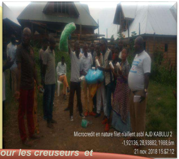
Microcredit en nature filet n'aillent asbl AJD KABULU 2 -1,92136, 28,93882, 1988,6m 21 nov. 2018 15:57:12

Kits pour moteur (pompe) pour les creuseurs et vache pour les jeunes désœuvrés pour appuyer l'activité de boucherie