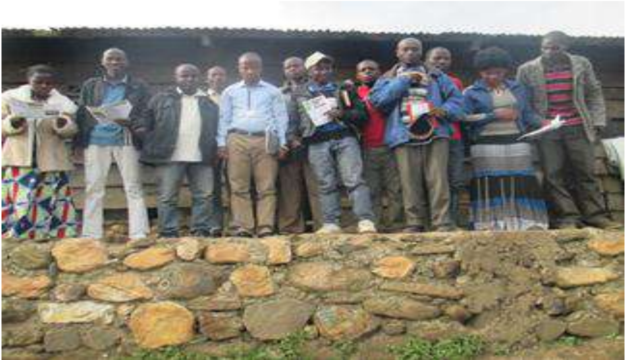
Photo des membres en formation dans la salle de l'église locale de Numbi, du 6 au 7 déc.

À la fin de la formation, les membres ont estimé avoir maîtrisé l'essentiel des enseignements et ont rassuré le formateur de leur détermination à pouvoir répondre aux attentes de l'AAP qui a chargé à CADERSA asbl, la mission de terrain.