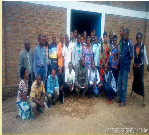
L'Atelier d'identification et priorisation des besoins