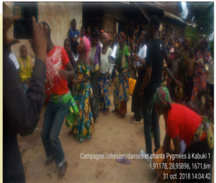
Campagne cohésion/danses et chants Pygmées à Kabuku 1 -1,91178, 28,95896, 1671,6m 31 oct. 2018 14:04:42