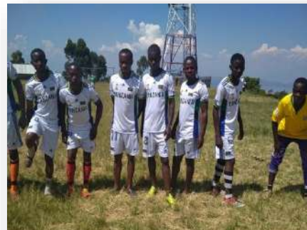
L'Equipe A.S. de Nyabibwe

MATCH DE FOOTBALL : L'Equipe A.S de Nyabibwe contre l'Equipe 11 Stars