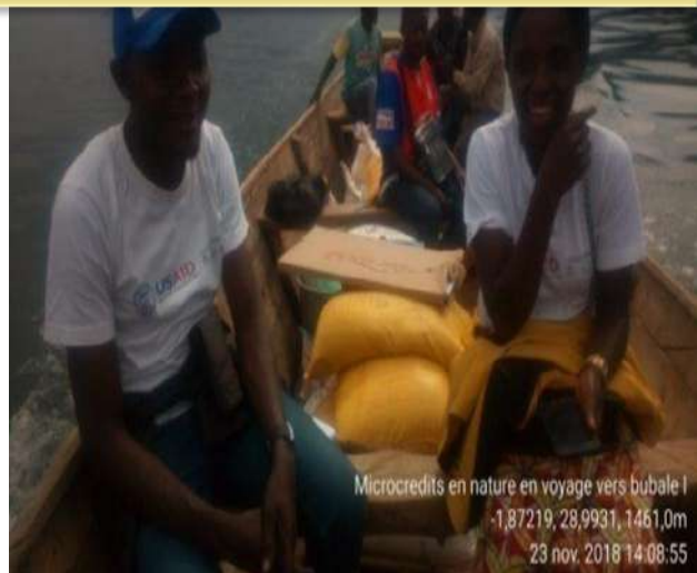
Microcredits en nature en voyage vers bubale I