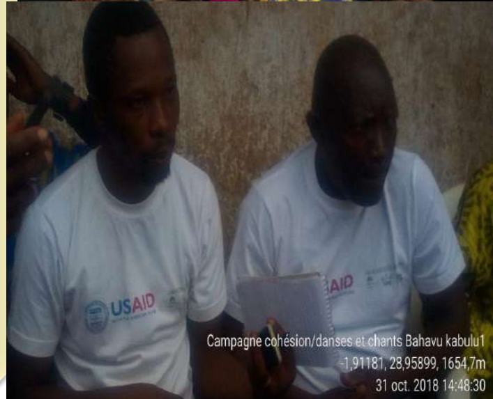
Campagne cohésion/danses et chants Bahavu kabulu1 -1,91181, 28,95899, 1654,7m 31 oct. 2018 14:48:30