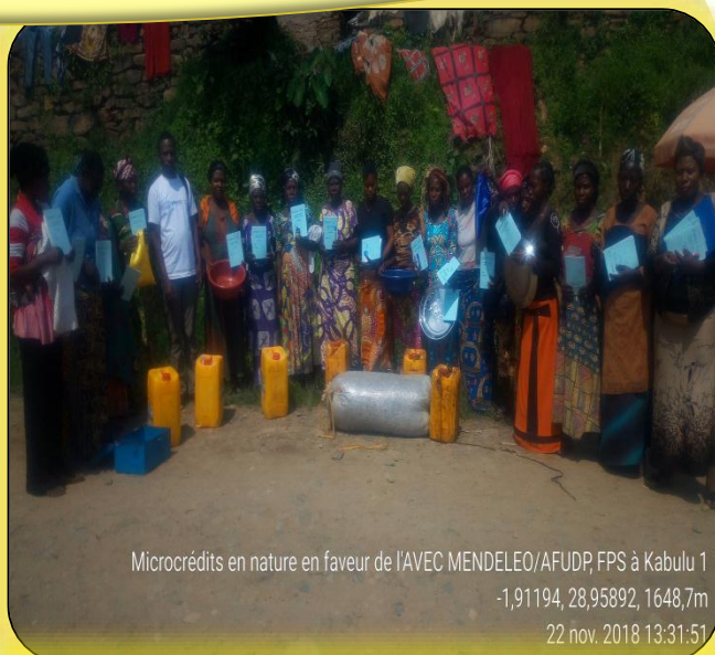
Microcrédits en nature en faveur de l'AVEC MENDELEO/AFUDP, FPS à Kabulu 1 -1,91194, 28,95892, 1648,7m 22 nov. 2018 13:31:51

20 OBC regroupant 500 personnes bénéficient directement des microcrédits en nature. Il s'agit: