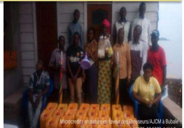
Microcredits en nature en faveur des Creuseurs/AJCM à Bubale